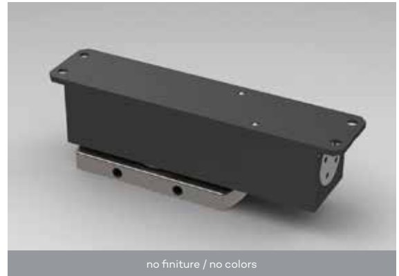
no finiture / no colors

Project profile at the customer's discretion